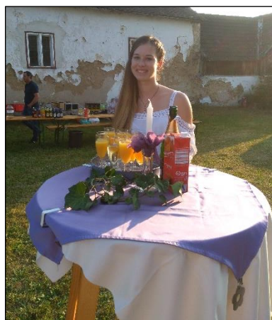
Die Gäste wurden mit Sekt und einem charmanten Lächeln begrüßt.