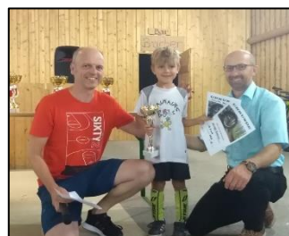
Jüngster Teilnehmer: 6 Jahre