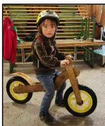
Früh übt sich, wer ein Meister werden will